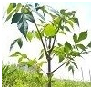
斜面地の皇帝ダリア1期生 (2023/04/28 撮影 N.K)

4月16日(日): 9:30 第2公園に集合しラジオ体操。その後は3名が自治会の清掃活動に、残り10余名が斜面地での花壇づくりと除草。なお、当日午後予定していたコーラスは事情により中止、活発に活動中で練習曲は『翼を下さい』『花』など多数。8月17日上大岡駅ビルで開催予定の発表会など、10月までに四つの発表会を計画し、練習に励んでいます。