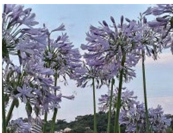
鷹中正門前：アガパンサスが満開です！(2023/7/02)