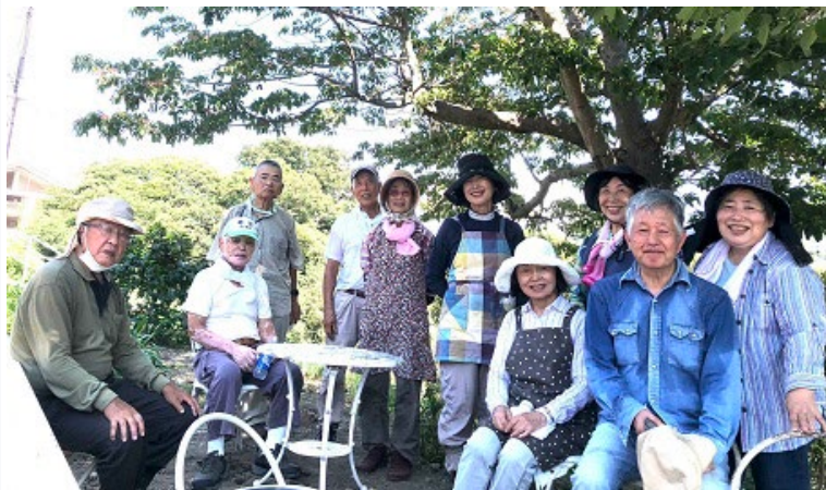
椅子とテーブルでお待ちしています!

現在はこの斜面地の整備を進め、調和のとれた状態を維持するため、懸命の努力を続けています。ある意味、雑草との闘いが日常になっています。以上、この活動に関心ある方、またご一所に汗を流していただける方々には、どうぞ下記の連絡先にご連絡いただけるようお願い致します。緑化活動の外に、近くを1時間ほどかけてお話ししながら散策する「歩こう会」も開いています。