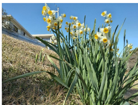
斜面地のスイセン (2026/2/1)

何とか人手をかけないで、除草が出来ないか考え、まずヤギを導入し、ヤギに雑草を食べてもらえないか検討しました。レンタルでヤギを導入する方法がありましたが、2時間のレンタル・2頭のヤギで3万円という情報です、これではいくら料金を要するか途方もない金額になりそうです。